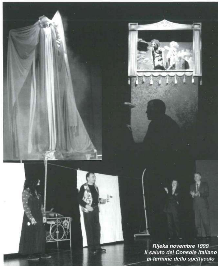
Rijeka novembre 1999 Il saluto del Console Italiano al termine dello spettacolo